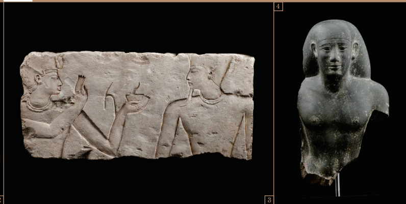
3. 王とアトゥム神のレリーフ／第3中間期・第22王朝 4. 役人の胸像／末期王朝時代・第26王朝