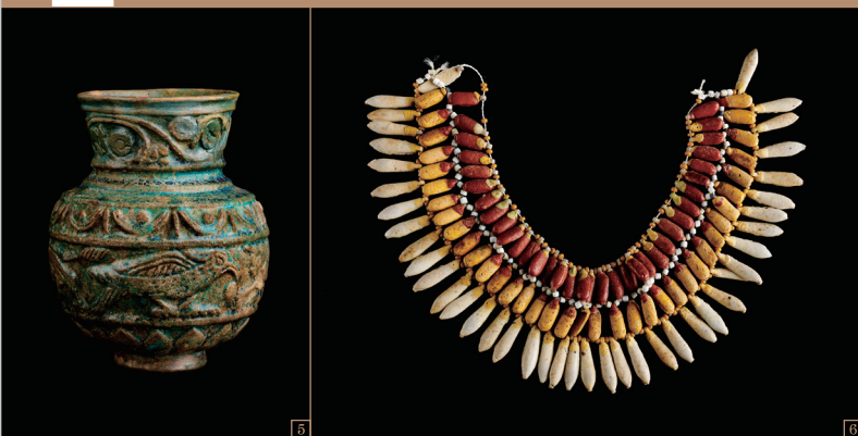
5. レリーフ装飾のある容器／ローマ支配時代 6. 花をモチーフにした胸飾り／新王国時代