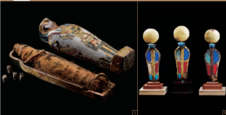
1. ホルスの4人の息子たちの護符とプタハツカル・オシリス神のミイラ／末期王朝～プトレマイオス朝時代 2. ウラエウス髪子装飾／新王国時代・第18王朝