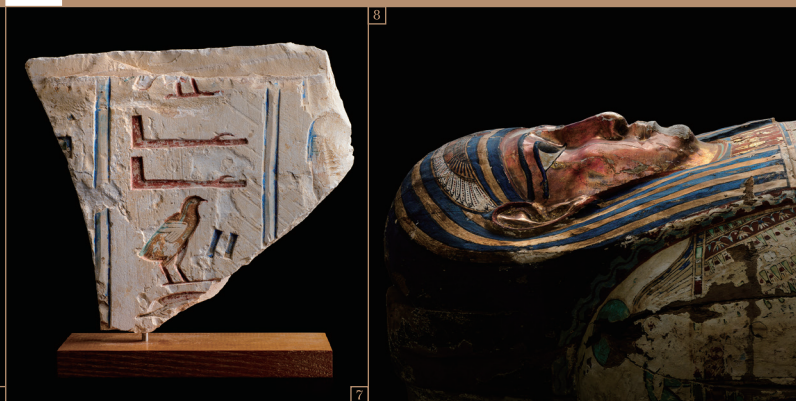
7. ヒエログリフが刻まれたレリーフ／末期王朝時代 8. 人型木棺／プトレマイオス朝時代初期