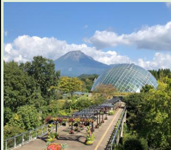
〈とっとり花回廊〉(イメージ)