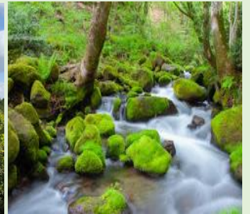
〈木谷沢溪流〉(イメージ)

WeLove山陰キャンペーン割引適用：鳥取県プレミアムクーポン 2,000円分付