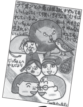
<第38回コンクール入賞作品>